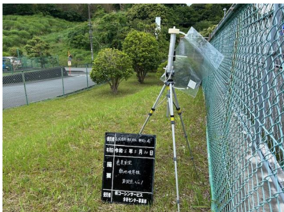
【静岡工場】2024年5月30日 測定状況