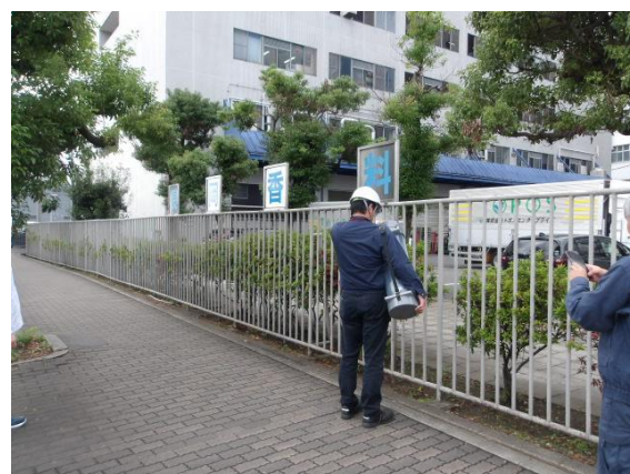
【大阪工場】2024年10月9日 測定状況